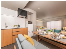
キッチン&ダイニング