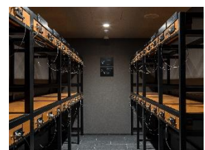
バゲッジストレージ

京都を拠点にして近隣の観光都市に出かけたい時、大きな荷物が邪魔になることも。『MIMARU 京都 河原町五条』では宿泊前後や中抜け宿泊時の荷物預かりサービスをご用意し、周遊旅を応援します。