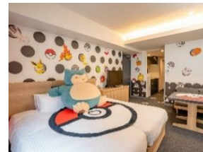
ポケモンルーム（イメージ）