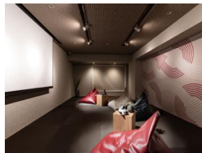
エンターテインメントルーム