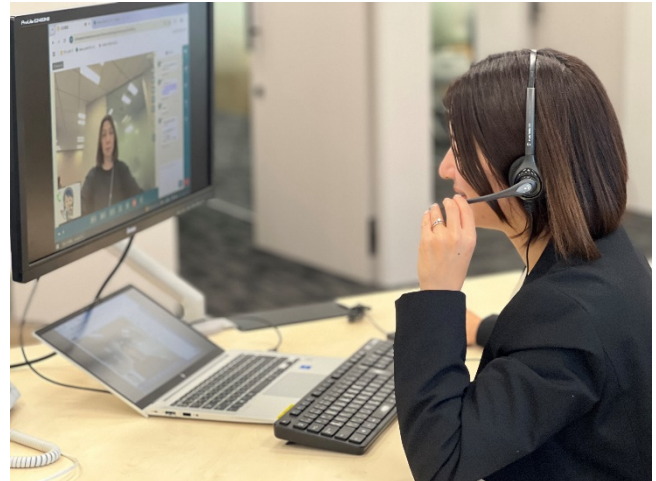
「Remo_info」オペレーターイメージ