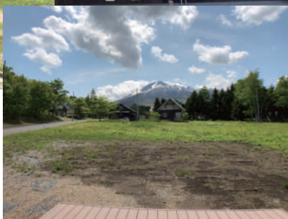
ウッドデッキからの眺望 2020年6月撮影