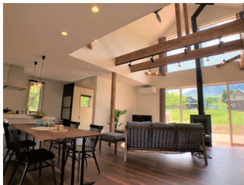
ダイニングからリビング