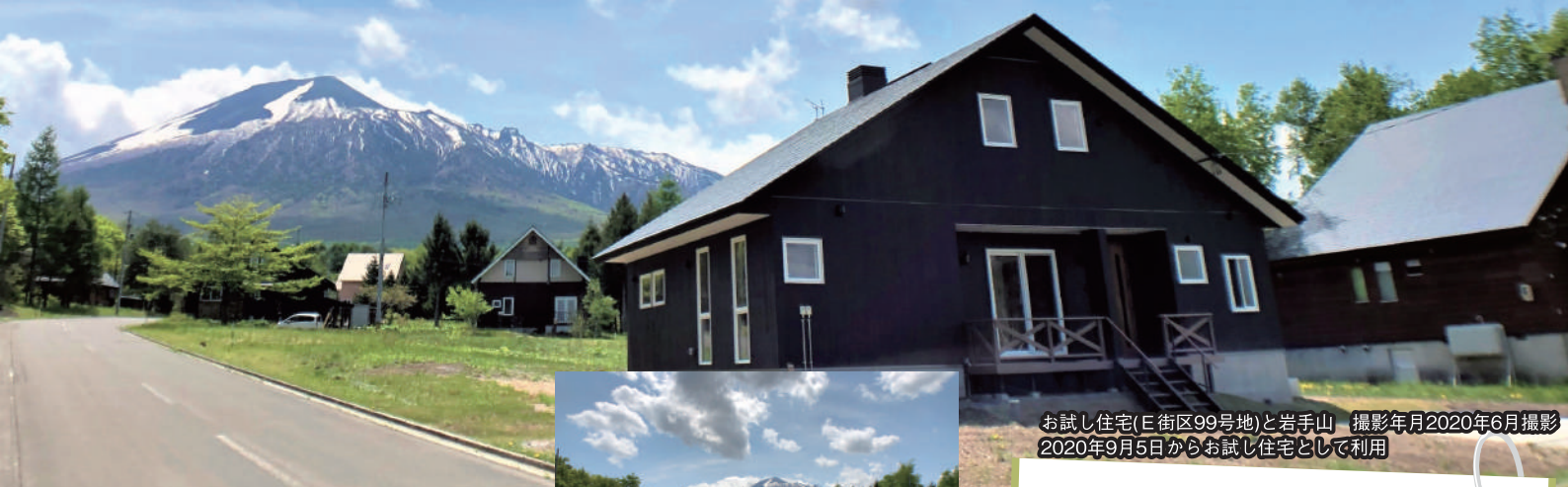
お試し住宅(E街区99号地)と岩手山 撮影年月2020年6月撮影 2020年9月5日からお試し住宅として利用