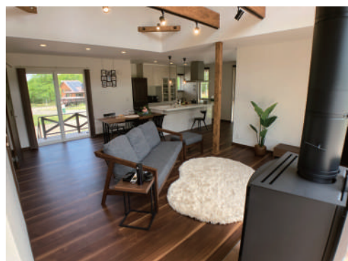
リビングからダイニング・キッチン