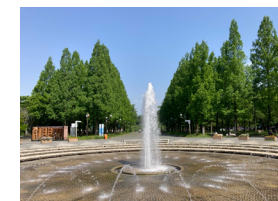
花博記念公園鶴見緑地(大阪府)

※大和リースが、代表企業として実施している案件と協力企業として実施している案件の合計数(2024年5月時点)